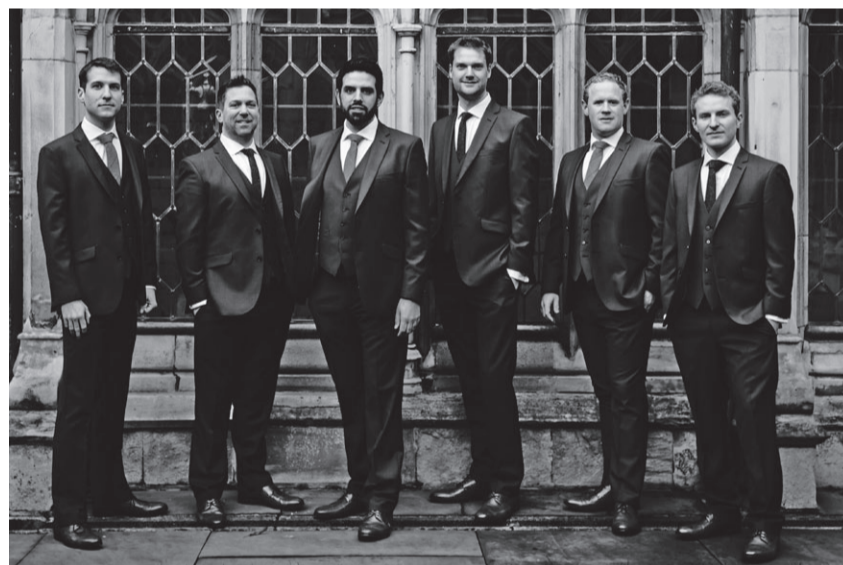
«The Queen`s Six»: Folkmusik und traditionelle englische Vokalmusik