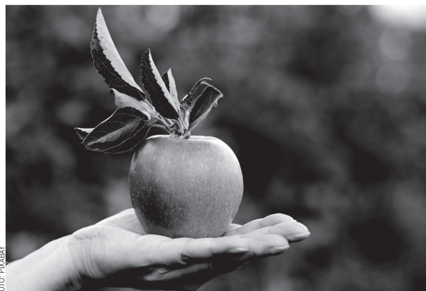
Apfelschuss – der triumphierende Höhepunkt einer Erfolgsgeschichte.

«Von Äpfeln und Schüssen» Armbrust = Swissness. Tells Apfelschuss ist das Symbol unserer nationalen Identität als rebellische Schweiz. Darum werden wir uns am Nationalfeiertag mit Äpfeln, Versuchungen und verschossenen Para- diesen näher befassen - und vielleicht so- gar unsere Adamsäpfel tanzen lassen beim Juchzen und Jodeln!